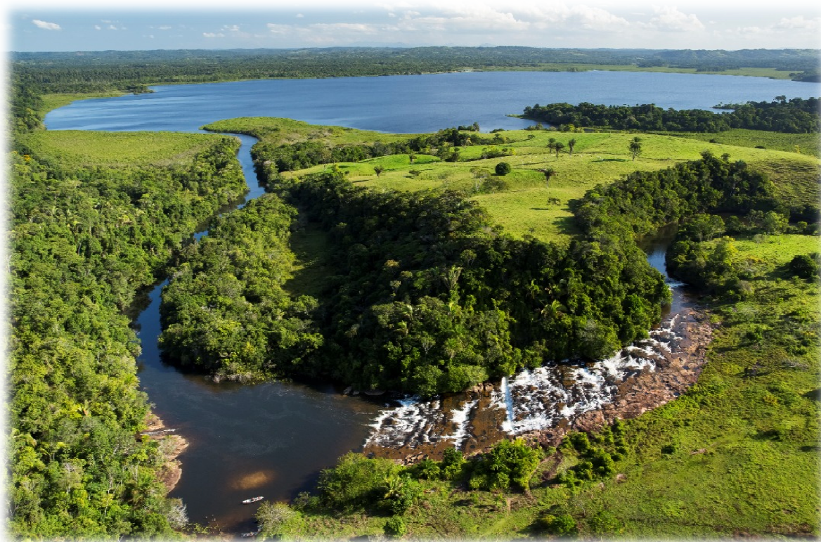
Lagoa Encantada